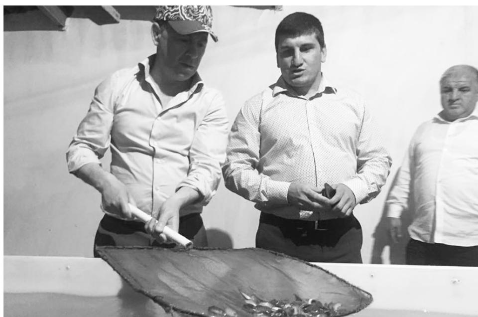
разнообразный выбор продукции. Основной проблемой, требующей

На предприятии установлено оборудование, позволяющее перерабатывать рыбу до глубокой стадии, в том числе коптить, солить и мариновать, то есть поставлять на рынок