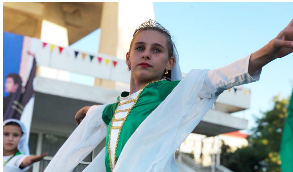
года, посвящен 95-летию со дня рождения народного поэта Дагестана Расула Гамзатова.