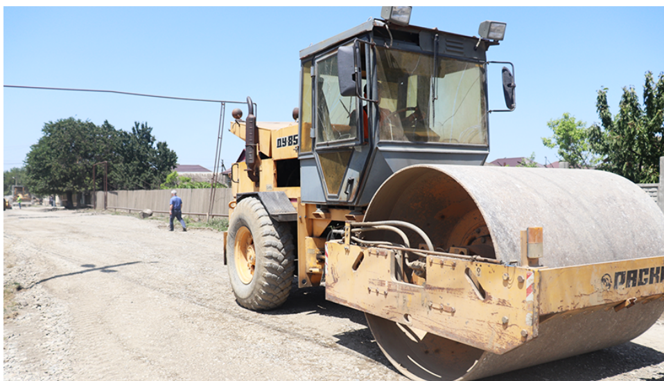
Манаша Магомедова